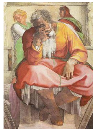
Jérémie - Michel-Ange - Chapelle Sixtine

Jean-Paul II « n'ayez pas peur » et Aaron sur la Mer Rouge « Je suis avec vous, j'entends et je vois »